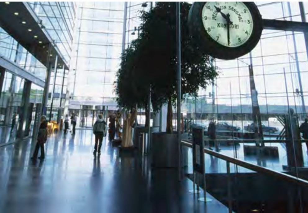
Sanomatalo, Arkkitehtitoimisto SARC, 1999