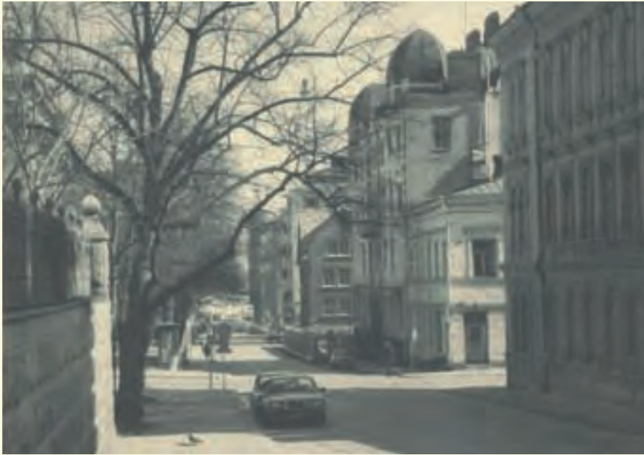
KIRKKOKATU, KRUUNUHAKA, 1980 / PENTTI SAMMALLAHTI