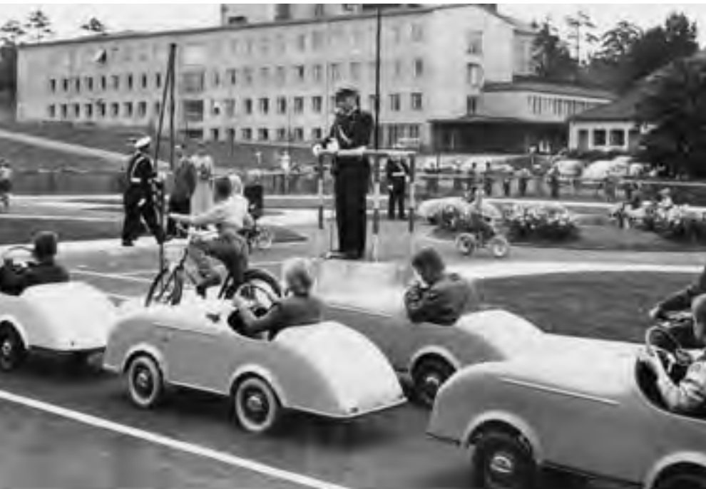
Lasten liikennekaupunki Laaksossa on rakennettu vuonna 1958 ja sen peruskorjaus on valmistunut vuonna 2006