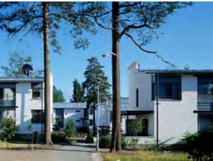
Köökarinkuja 7, Arkkitehdit