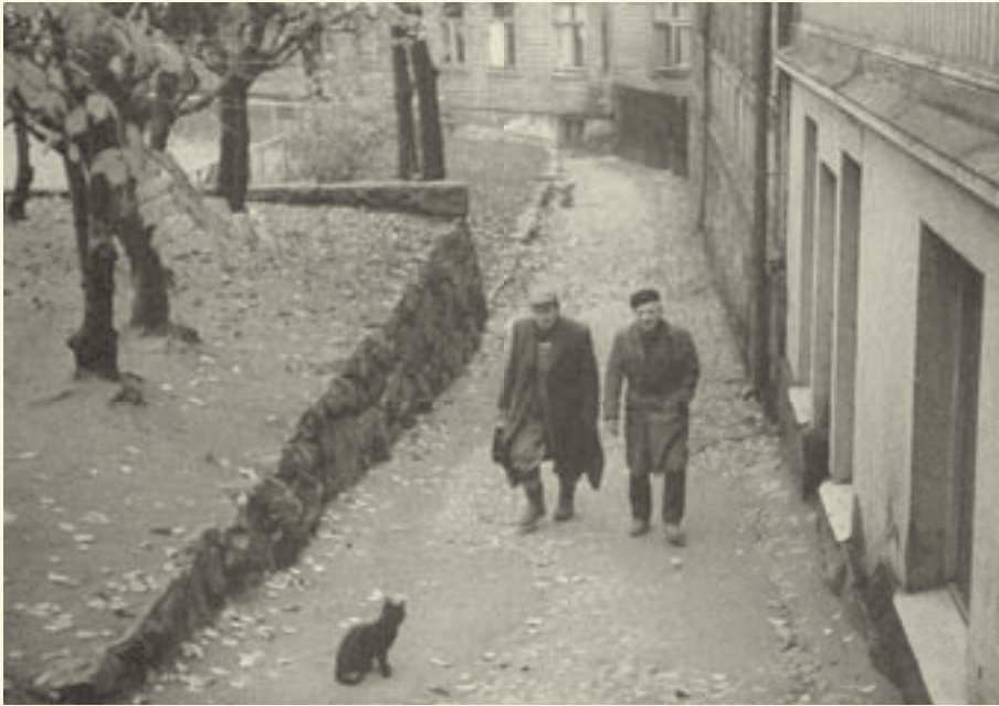
LAPINLAHDENKATU, KAMPPI, 1965 / PENTTI SAMMALLAHTI