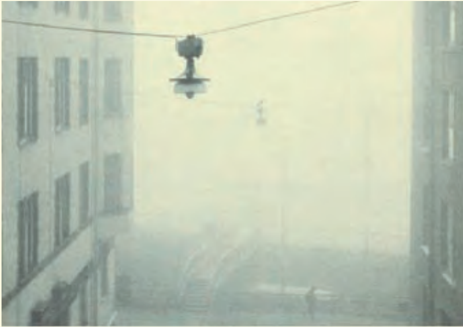
VÄLIKATU, KRUUNUHAKA, 1981 / PENTTI SAMMALLAHTI