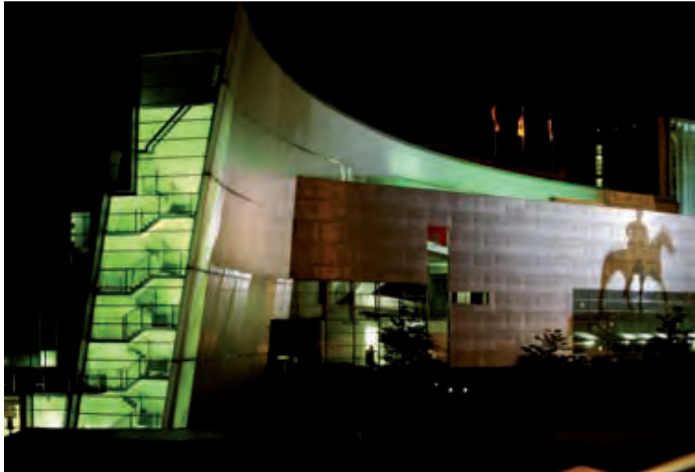
Kiasma, arkkitehti Steven Holl, 1998 Ari Leppä

suutta. Monotonisuuden sijaan haetaan osa-alueiden identiteettiä. Innovatiiviset ratkaisut ammentavat myös perinteestä. Kaupunkilainen ei tyydy ylhäältä tarjottuun. Tarvitaan vaihtoehtoja ja luovaa keskustelua.